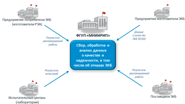
Рис. 1. Схема сбора информации о качестве и надёжности ЭКБ с этапов производства, применения и эксплуатации на базе ФГУП «МНИИРИП»

По результатам анализа предложений и замечаний (более 500 отзывов) подтверждена актуальность и