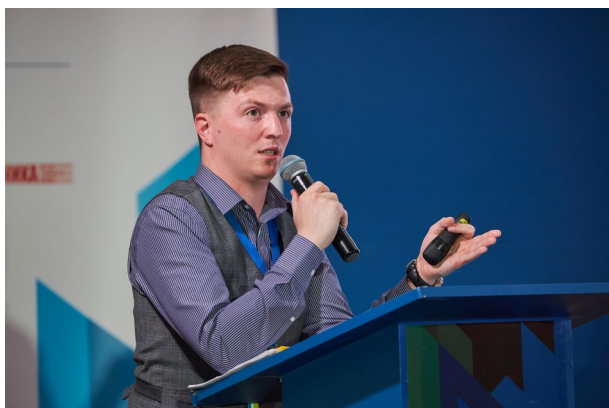
Невский А. А.

Keywords: electronic component database, quality, reliability, collection, processing, analysis, information about the quality and reliability of electronic component base, electronic component base failures.